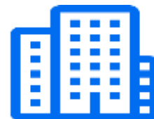
Рабочий орган (РО) при АО «Нац. научный центр материнства и детства»

Шаг 3. 2 дня. РО запрашивает: - Программу лечения - Ценовое предложение