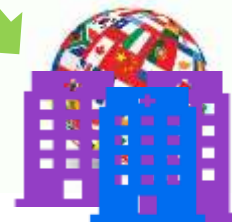
Зарубежные медицинские организации

Шаг 4. 15 дней. Заруб. МО направляют: - Программу лечения - Ценовое предложение