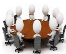
Комиссия при Министерстве здравоохранения РК

Шаг 5. 1 день. РО направляет список заруб. МО на Комиссию при МЗ РК