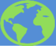
Схема направления граждан РК на лечение за рубеж за счет бюджетных средств