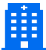
Выбор зарубежной МО, согласованной с пациентом

Шаг 7. 10 дней. РО заключает договор с зарубежной МО