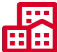
Профильная научно-исследовательская организация (НИИ) (11)

Шаг 2. 3 дня. НИИ направляет в РО: 1. Ходатайство 2. Копию удост. личности 3. Выписку из истории болезни 4. Заключение ВКК 5. Заключение НИИ