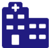
Врачебно-консультативная комиссия (ВКК) при поликлинике

Шаг 2. 3 дня. НИИ направляет в РО: 1. Ходатайство 2. Копию удост. личности 3. Выписку из истории болезни 4. Заключение ВКК 5. Заключение НИИ